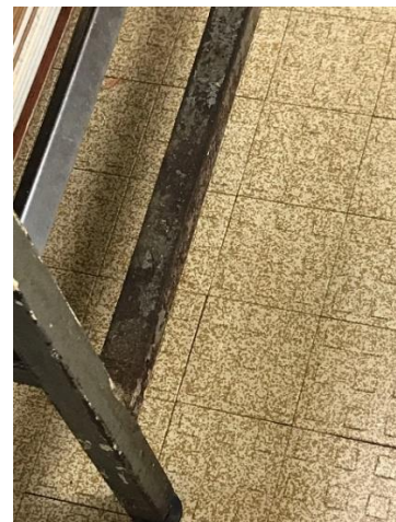
table de travail rouillé en cuisine

Le directeur a déjà informé l'interlocuteur, ce dernier étant en congés, nous reviendrons vers vous sur ce sujet.