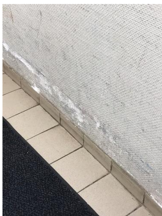
Revêtement murs abimé