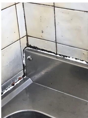
Joint bac de trempage noircis