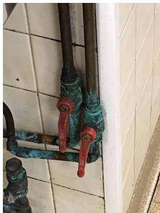
Tuyauterie vert de gris