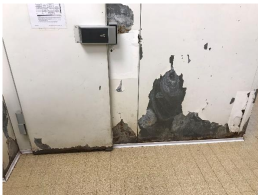
Chambre froide ecaillé