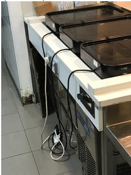
Bercy stand chaud bouillant

Le personnel employé et encadrant sont t ils informés du risque ? qui est responsable en cas d'électrocution?.