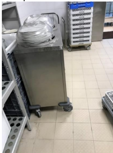
chariot qui roule mal

Nous sommes actuellement en appel d'offre. Des travaux sont prévus pendant les mois de juillet-août. Investissement prévu dans le cadre de l'AO.