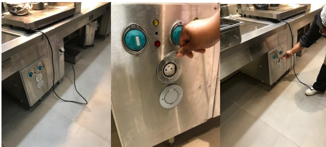
Le RU fait une demande auprès d'ISCO pour intervention.

Sur le site Victoire au self les prises s'enfoncent quand on branche un câble d'alimentation une prise cela fait disjoncter également le reste des équipements, quel plan d'action est-il prévu pour résoudre ce problème ?,en outre un câble traine a terre il y a risque de chute (voir photo )