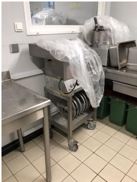
Le coupe légume a été remplacé la semaine 8 (semaine du 21 au 27 février 2022).