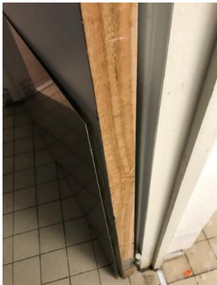
Le bas de porte a été recollé le vendredi 11 mars 2022.